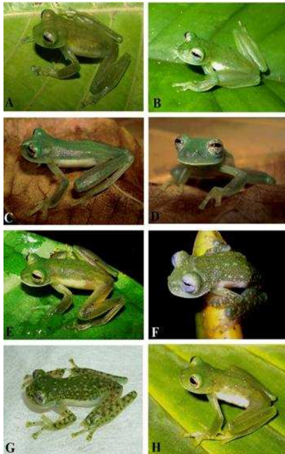
Figura 1: (A) Centrolene audax , macho, DHMECN 06788; (B y E) Centrolene durrellorum , machos, DHMECN 03492 y 06794, (C y D) hembras, DHMECN 06793; (F y G) Nymphargus puyoensis , machos, DHMECN 04753 y 06190; (H) Nymphargus siren , macho, DHMECN 04864.

alta del Río Coca entre 1250 y 1700 m [[10]]. Un espécimen colectado en la provincia de Pastaza en la Reserva Biológica Anzu (DHMECN 04864, Tabla 1), corresponde al primer registro para la provincia e incrementa la distribución latitudinal de la especie en 108 km al sur y su límite altitudinal inferior a 1100 m de altura. El rango de LRC reportado para N. siren es de LRC 19.8–22.0 mm en machos [[28]], nuestro espécimen macho adulto mide 24.7 mm. Nymphargus siren habita en los ecosistema de Bosque Siempreverde Montano Bajo y Bosque Siempreverde Piemontano [10].